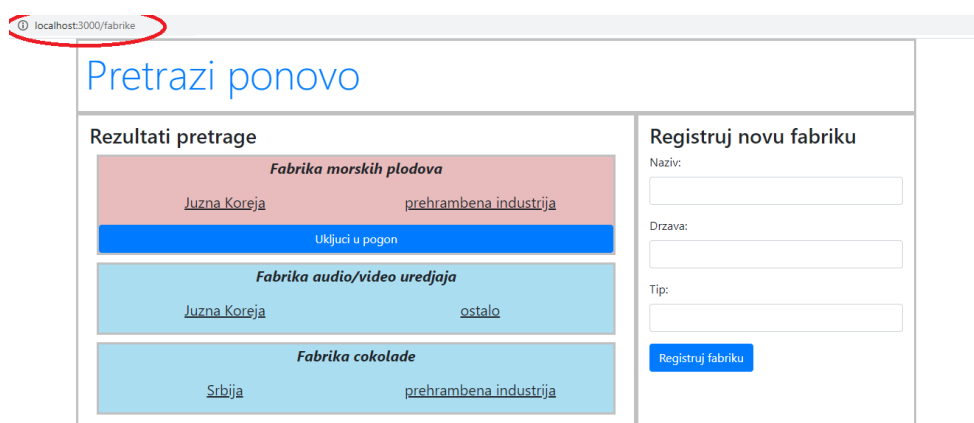
Slika 4: Rezultati pretrage za prazan upit (tj. http://localhost:3000/fabrike?tip= ) ili bez navođenja bilo kakvog upita (tj. http://localhost:3000/fabrike ).